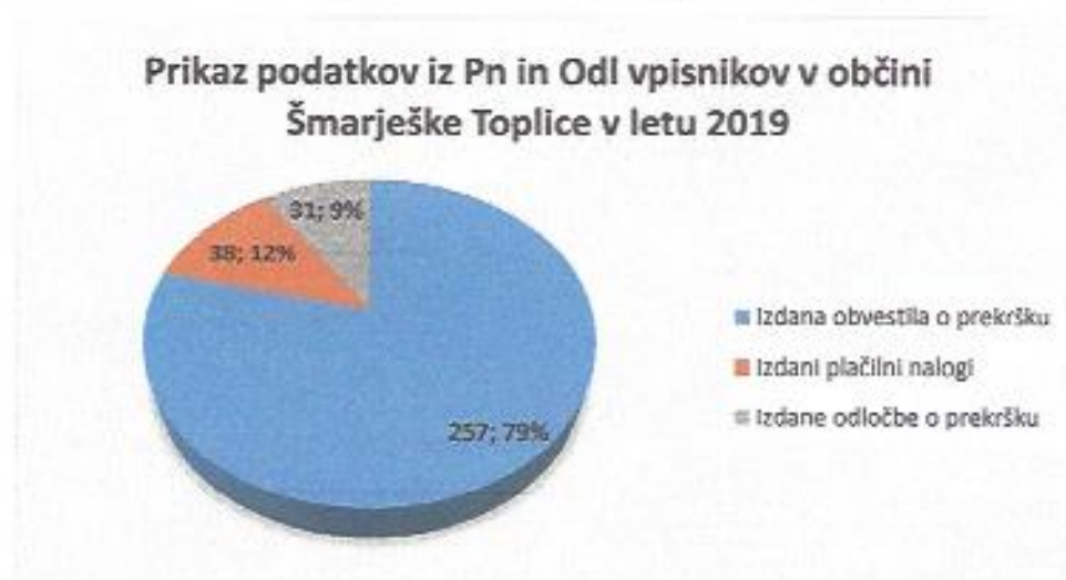
Graf 2: Prikaz podatkov iz Pn in Odl vpisnikov za leto 2019