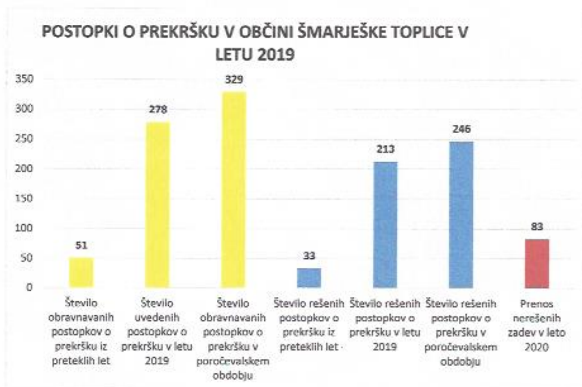
Graf 1: Prikaz podatkov iz Pn in Odl vpisnikov za leto 2019