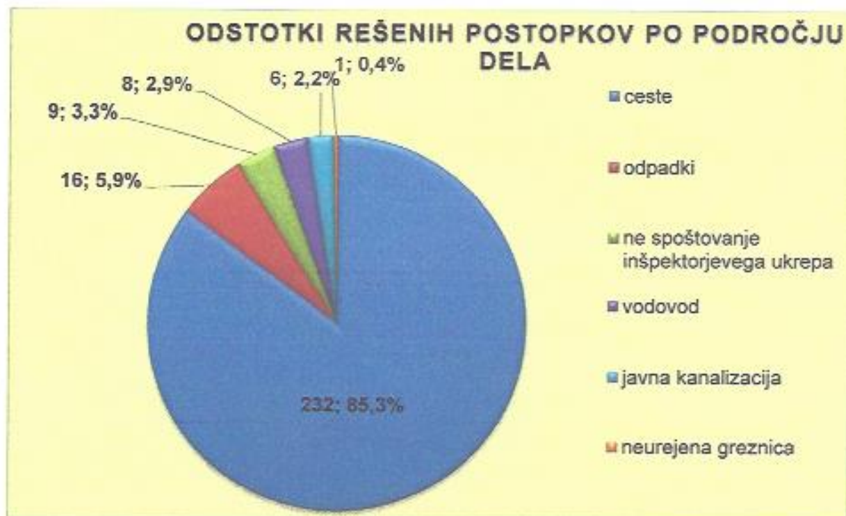
Graf 5: Odstotki rešenih postopkov po področju dela