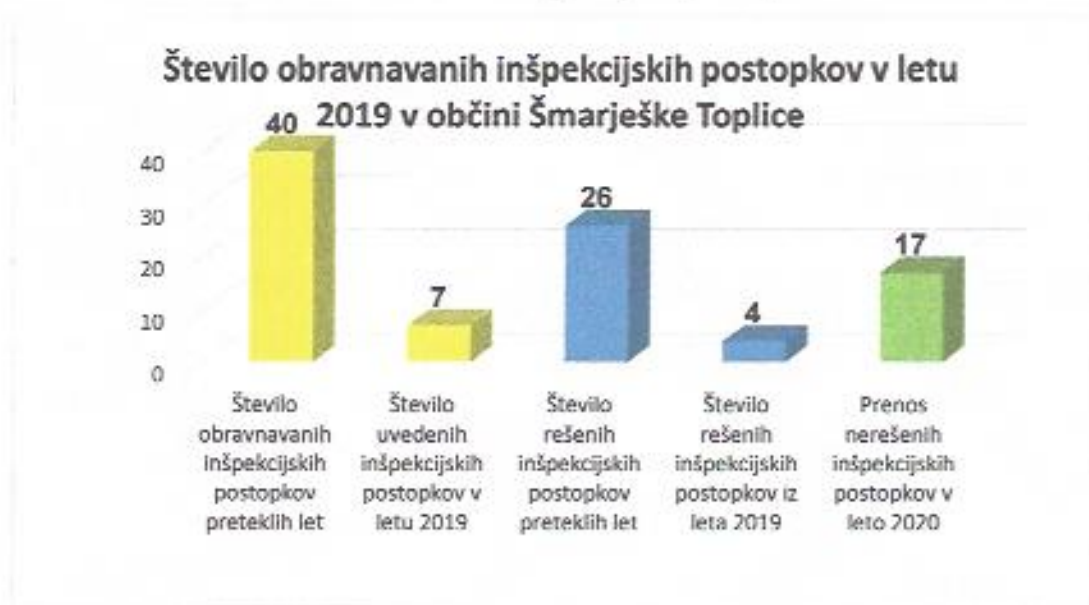
Graf 3: Število obravnavanih inšpekcijskih postopkov v letu 2019

(1.200,00 eurov v letu 2018). Na FURS je bilo vloženi 12 (10) predlogov za izterjavo neplačane denarnih kazni v upravni izvršbi v skupni višini 5.050,00 (3.400,00) eurov. FURS je na predlog Medobčinskega inšpektorata v poročevalskem obdobju izterjal 3.466,49 (4.353,51) eurov neplačanih denarnih kazni v upravni izvršbi. Pri višini izterjanih denarnih kazni v upravni izvršbi je potrebno upoštevati tudi izterjane denarne kazni v upravni izvršbi, ki so bile vložene v izterjavo pred poročevalskim obdobjem.